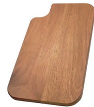
Tabla de corte de madera Iroko 8643 115